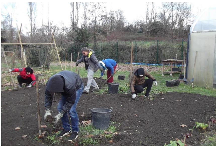
Atelier Jardin par tous les temps

L'action se réalise en conformité avec le cahier des charges de l'Atelier Passerelle validé par la Collectivité Européenne d'Alsace début 2014 et s'inscrit dans le cadre du programme opérationnel FSE 2023-2025.