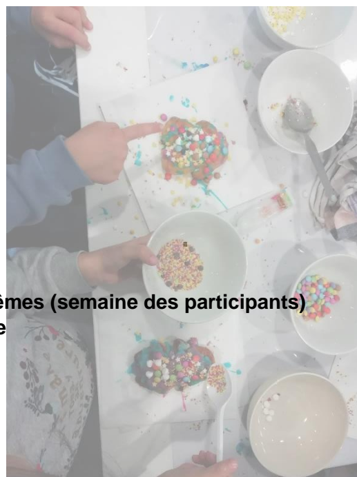
Atelier Maneles décorés par les enfants du quartier de l'ELSAU avec l'aide d'un groupe des ateliers passerelle.