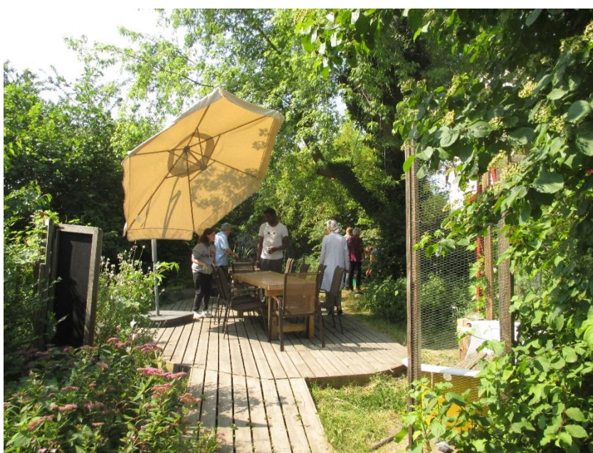
Barbecue convivial entre intervenants et participants.

On nous fait régulièrement part d'un réel attachement au lieu et à l'équipe, oasis de nature dans la ville ; le cadre chaleureux de nos locaux est apprécié, ce qui parfois réveille un sentiment d'appartenance. Un sentiment que certains n'ont pas ressenti depuis longtemps et sur lequel notre équipe s'appuie car il est source de confiance en soi et donc de potentielle évolution.